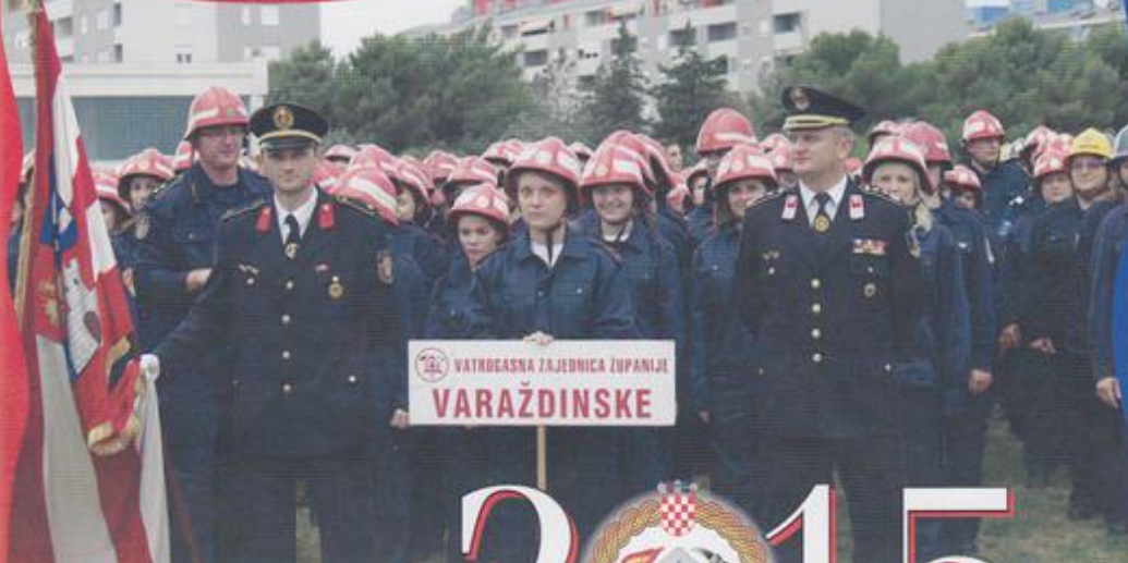
VATROGASNA ZAJEDNICA ŽUPANIJE VARAŽDINSKE