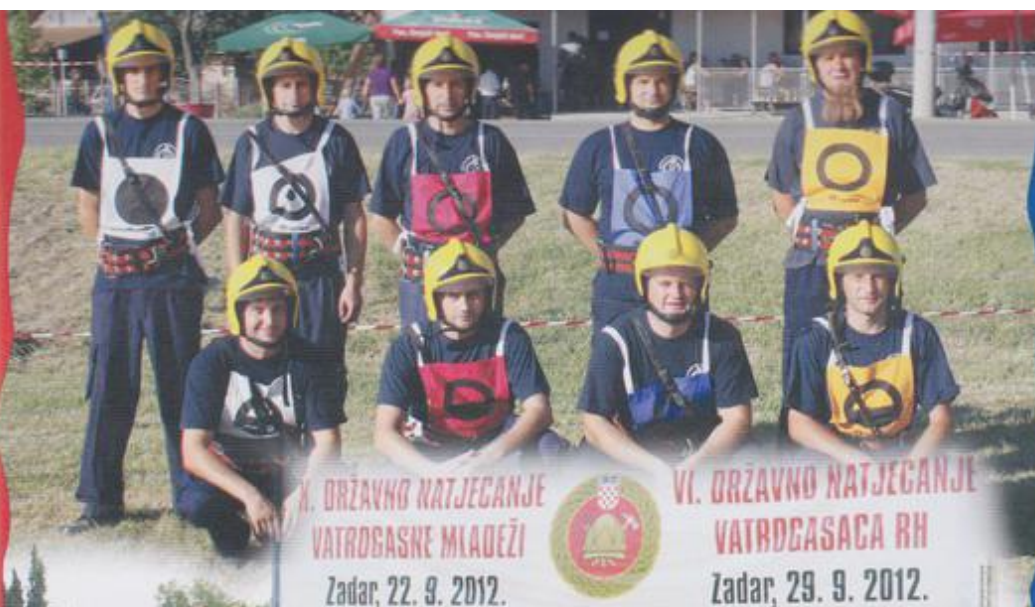
V. DRŽAVNO NATJEGANJE VATROGASNE MLADEŽI Zadar, 22. 9. 2012. VI. DRŽAVNO NATJEGANJE VATROGASACA RH Zadar, 29. 9. 2012.