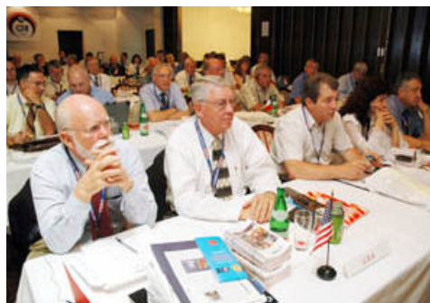
Izaslanstvo SAD-a na Skupštini CTIF-a

Tijekom sjednice usvojena su izvješća o radu u proteklom razdoblju, u kojem se posebna pažnja posvetila radu s mladima, održavanju vatrogasnih natjecanja i niza radnih simpozija. Delegati su prihvatili i nove predložene članove: 9 novih organizacija i tvrtki te 6 novih zemalja iz Srednje Amerike. Skupština CTIF-a prihvatila je i smjernice za rad do 2010. godine, u kojima posebno naglašava potrebu modernizacije organizacije, od osuvremenjenog grafičkog predstavljanja do uspostavljanja jedinstvenog informatickog sustava, proširenja djelatnosti i na spasilacke službe te nove donatore – kako bi CTIF prerastao u suvremenog partnera svjetskog partnera brojnih država, europskih i svjetskih organizacija. Predstavljen je i 10. Statistički izvještaj koji uključuje požarnu statistiku iz 85 zemalja svijeta koje predstavljaju tri četvrtine svjetske populacije, uključujući i 90 najvećih gradova svijeta.