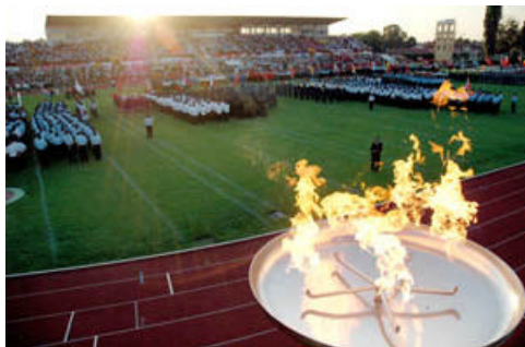
Gasi se plamen na Vatrogasnoj olimpijadi koja je potukla sve rekorde

Prije završnog mimohoda svih sudionika do sada najmasovnije Vatrogasne olimpijade nazocnima se obratio i Walter Egger, predsjednik CTIF-a: «Iza nas je fer i nezaboravno natjecanje, koje je pokazalo kako vatrogasci nemaju jezičnih barijera i kako naše prijateljstvo seže preko svih granica. Ovo je natjecanje bilo lijepo i nezaboravno iskustvo. Varaždin cemo napustiti sa suzama u ocima, ali i s osmijehom na licu. Ovdje smo proveli divne dane koji ce biti lijepo i nezaboravno iskustvo.» Rijeci su to podrške koje od celnog covjeka ove svjetske asocijacije nacionalnih vatrogasnih saveza nisu nedostajale tijekom cjelokupnog pripremnog razdoblja.