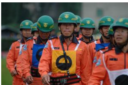
Vatrogasci iz Južne Koreje pred službeni nastup

Spomenimo i zanimljiv podatak kako su vrlo dobar rezultat među muškim ekipama ostvarili i članovi vatrogasne postrojbe iz Južne Koreje. Pripadnici vatrogasne postrojbe Pyong-Chang prikazali su zavidnu koordiniranost s obzirom na vrlo kratke pripreme, a kao posebni gosti domaćina svoj su doprinos dali i u mnogim drugim događajima na Olimpijadi.