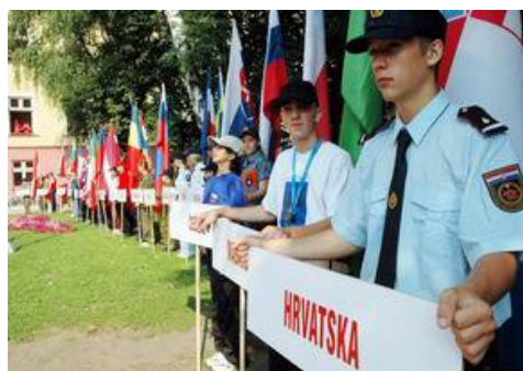
Detalj s otvaranja Kampa mladeži

Rezultati natjecanja postignuti u Varaždinu među najboljima su u povijesti održavanja Vatrogasnih olimpijada, a postignuti su i neki rekordi. Najviše je ekipa nastupalo u okviru tradicionalnog vatrogasnog natjecanja, čije se osnovne propozicije nisu mijenjale u posljednjih 30-tak godina. Vježbu u kojoj se međusobno spajaju usisne cijevi, motorna pumpa i tlačne cijevi, odnosno ostala pripadajuća oprema, najbolje su izveli članovi FF Weeg iz Austrije. Zanimljivo je da je ekipa ovog dobrovoljnog vatrogasnog društva prvo mjesto u kategoriji muških dobrovoljnih vatrogasaca bez dodatnih bodova na starost, osvojila treći puta zaredom, a za što je neophodna izvrsna uvježbanost i disciplina kakvu možemo vidjeti kod rada u boksovima tijekom utrka Formule 1!