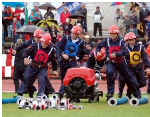
Odjeljenje Javne vatrogasne postrojbe Grada Varaždina na početku nastupa koji im je donio drugo mjesto

Rezultati natjecanja postignuti u Varaždinu među najboljima su u povijesti održavanja Vatrogasnih olimpijada, a postignuti su i neki rekordi. Najviše je ekipa nastupalo u okviru tradicionalnog vatrogasnog natjecanja, čije se osnovne propozicije nisu mijenjale u posljednjih 30-tak godina. Vježbu u kojoj se međusobno spajaju usisne cijevi, motorna pumpa i tlačne cijevi, odnosno ostala pripadajuća oprema, najbolje su izveli članovi FF Weeg iz Austrije. Zanimljivo je da je ekipa ovog dobrovoljnog vatrogasnog društva prvo mjesto u kategoriji muških dobrovoljnih vatrogasaca bez dodatnih bodova na starost, osvojila treći puta zaredom, a za što je neophodna izvrsna uvježbanost i disciplina kakvu možemo vidjeti kod rada u boksovima tijekom utrka Formule 1!