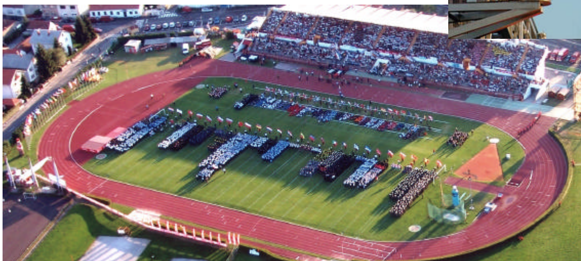
Impresivan detalj sa svečanog otvaranja - olimpijski je plamen zapaljen u Varaždinu