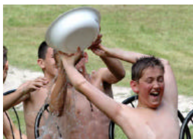
Zabavni trenuci tijekom „Olimpijade Kampa mladeži“

U natjecanju vatrogasne mladeži, a kojoj se u europskim državama pridaje posebna pozornost, nastupilo je 50 ekipa iz 26 zemalja. Pobjednički pehar među djecacima osvojili su mladi članovi FF Tragwein iz Austrije, dok je među njihovim vršnjakinjama najbolji rezultat ostvarila ekipa DHZ Siroke 2 iz Slovačke. Mladež iz domaćih hrvatskih ekipa DVD-a Strahoninec i DVD-a Draganovec bile su najbolje u atraktivnoj «Olimpijadi Kampa mladeži» koja se po prvi puta održala u središnjem varaždinskom gradskom parku, a sastojala se od 50 različitih zabavnih igara s vatrogasnim obilježjima.