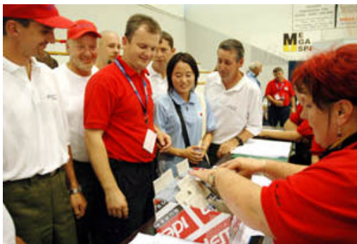
Detalj s akreditacije sudionika Vatrogasne olimpijade

Dolazak više od 3000 službenih sudionika Vatrogasne olimpijade u nedjelju, 17. srpnja, bilo je obilježeno njihovom akreditacijom. Umorna lica sudionika dočekao je smještak tehničkog osoblja i pronalaženje njihovog boravišta kroz sljedećih tjedan dana.