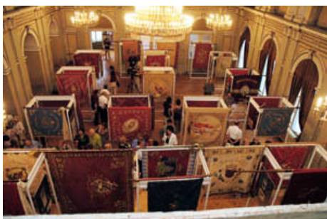
Izložba zastava vatrogasnih postrojbi privukla je veliku pozornost

Brojni su znatiželjnici tako mogli razgledati izložbu vatrogasne i spasilačke opreme, izložbu povijesnih vatrogasnih zastava, međunarodnu izložbu karikatura na temu vatrogastva (pristiglo je čak 700 karikatura iz 42 zemlje), izložbu poštanskih eksponata uključujući i prigodnu poštansku marku vezanu uz ovu vatrogasnu manifestaciju itd. Posebna je pozornost posvećena i Muzeju hrvatskog vatrogastva koji se također nalazi u Varaždinu, a sadrži vrlo vrijedne i rijetke eksponate.