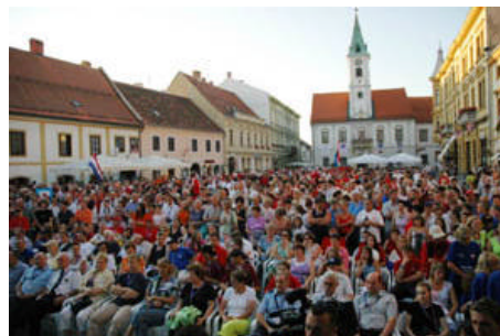
Navijaci na Predstavljanju nacija (središnji trg)