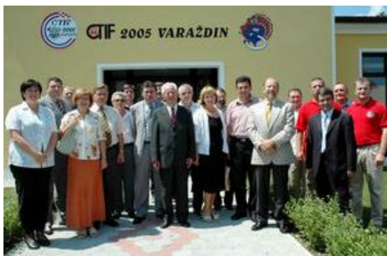
Članovi Nacionalnog organizacijskog odbora i Izvršnog odbora na sjednici uoči početka Vatrogasne olimpijade

Sukladno Operativnom planu rada za 2004. i 2005. godinu te usvojenim zaključcima na 8 sjednica Nacionalnog organizacijskog odbora, 6 sjednica Izvršnog odbora i 9 sjednica Kolegija Nacionalnog organizacijskog odbora, segmentirane su aktivnosti i imenovani voditelji pojedinih stručnih povjerenstava, dok su realizirane sljedeće značajnije zadace: