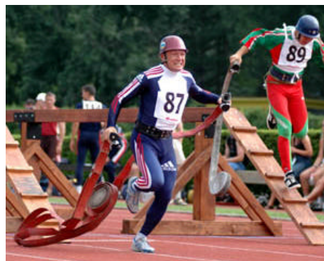
Detalji sa sportskog vatrogasnog natjecanja