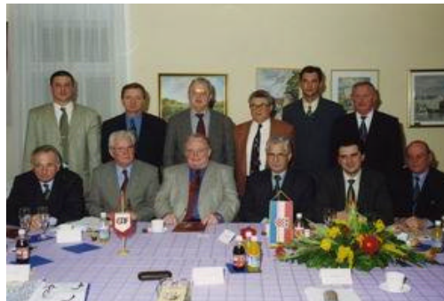
Prvi službeni posjet izaslanstva CTIF-a Varaždinu, 16. – 18. veljace 2001. godine

Osnivanjem Dobrovoljnog vatrogasnog društva «Prvi hrvatski dobrovoljni vatrogasni zbor u Varaždinu» 1864. godine, ujedno najstarijeg dobrovoljnog vatrogasnog društva u ovome dijelu Europe, stvoren je temelj za razvoj vatrogastva ove mlade europske države koje svojom tradicijom i organiziranošću pripada europskoj vatrogasnoj obitelji. To potvrđuje i sudjelovanje hrvatskih vatrogasnih organizacija u svim povijesnim europskim vatrogasnim događanjima, a posebno u sklopu Međunarodne zajednice vatrogasnih i spasilackih službi, poznate pod nazivom CTIF, od njezinog osnutka daleke 1900. godine.