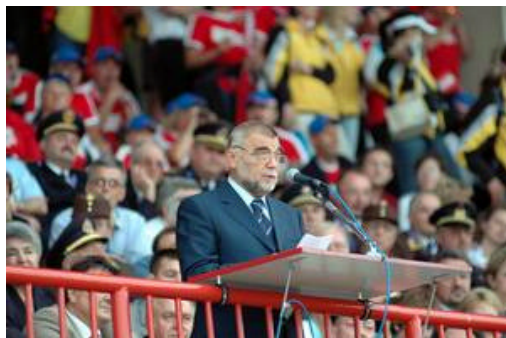
Pokrovitelj Vatrogasne olimpijade, hrvatski predsjednik Stjepan Mesic